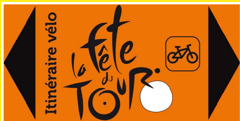
Indication de l'itinéraire recommandé à vélo

Tracé possible à vélo, en voiture ou à pied en suivant le fléchage