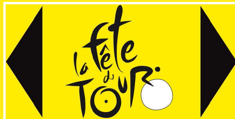
Indication de l'itinéraire de la Fête du Tour