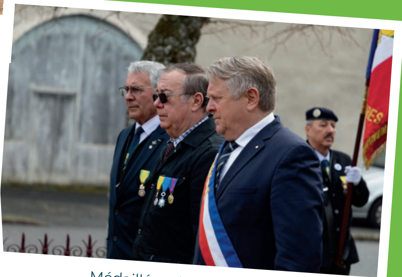
Médaillés militaires - mars