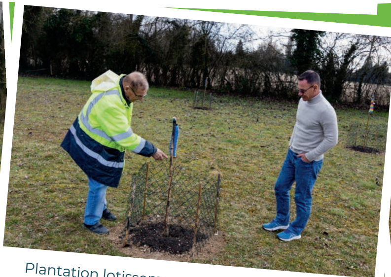
Plantation lotissement de l'Églantine - janvier