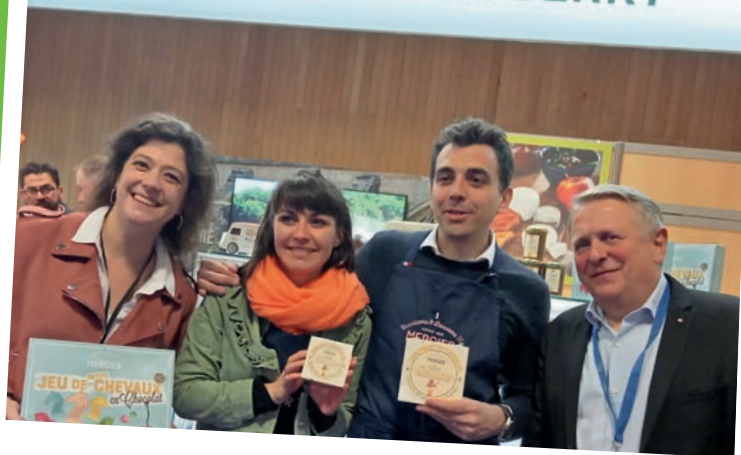
Salon de l'Agriculture - mars