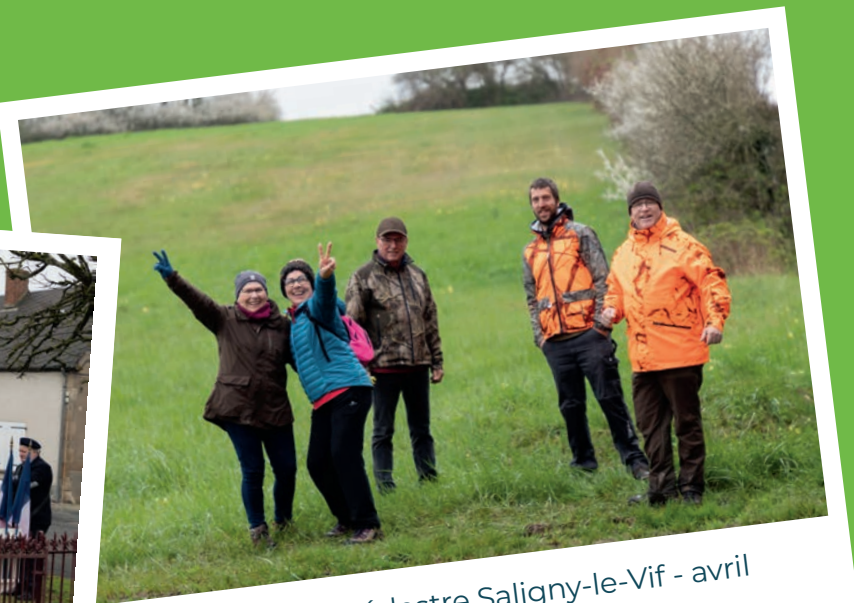
Randonnée pédestre Saligny-le-Vif - avril