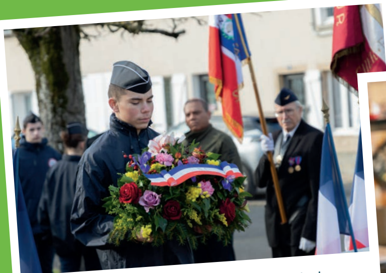
Cadets de la Gendarmerie - février