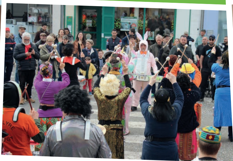
Carnaval - mars