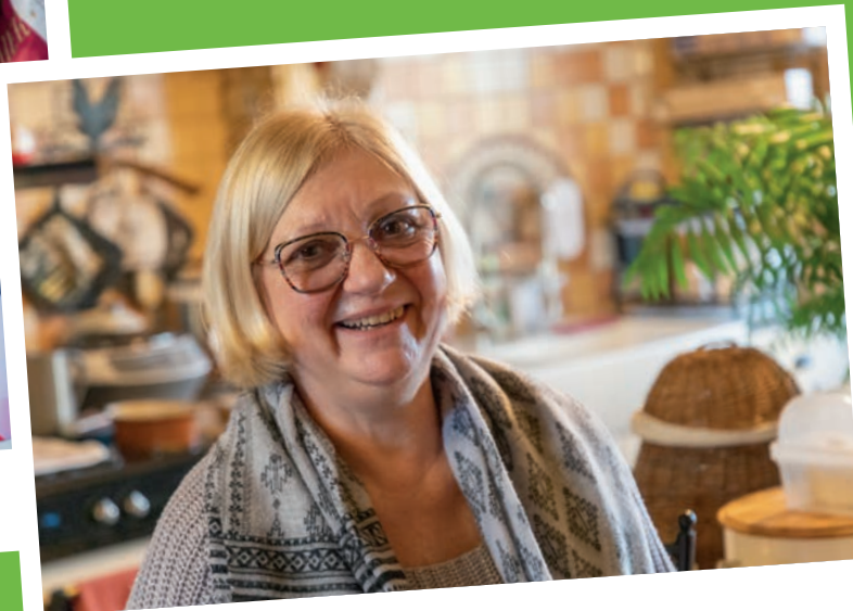
Accueil Familial et Social - février