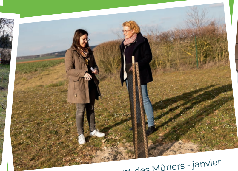
Plantation lotissement des Mûriers - janvier