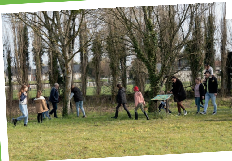
Chasse aux œufs - avril