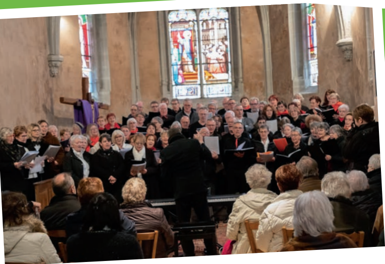
Chorales - mars