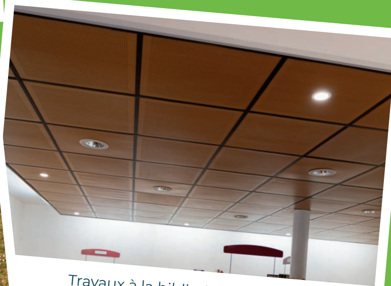
Travaux à la bibliothèque - avril