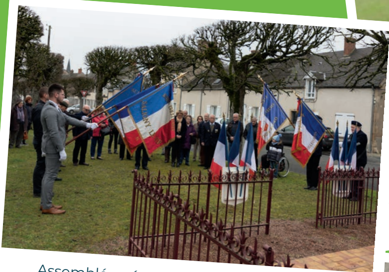
Assemblée générale - ACPG-CATM - mars